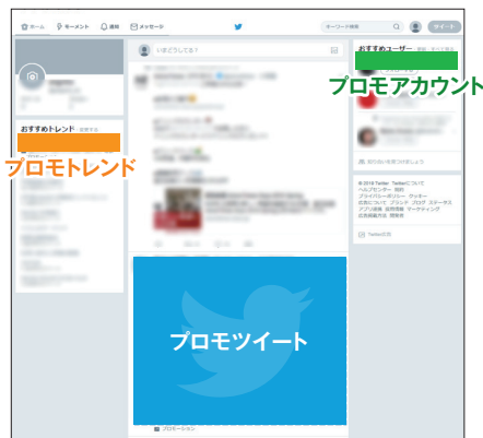
デスクトップの表示イメージ

フォローしていないアカウントの中で興味を持ちそうなアカウントをオススメする機能です。