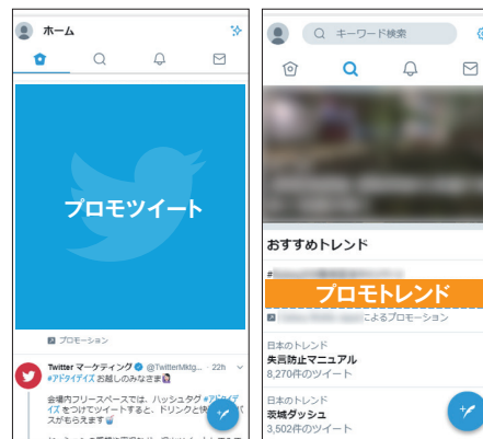
モバイルの表示イメージ